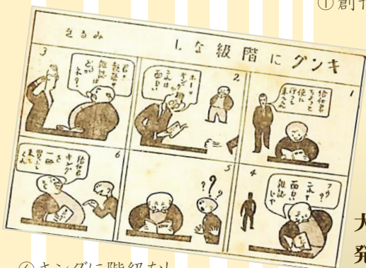
④キングに階級なし