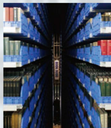
自動化書庫 (自然科学系 図書館)