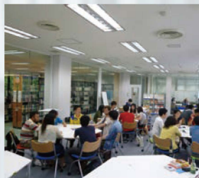
国際交流スタジオ (中央図書館)