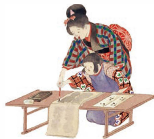
『加賀藩年中行事図絵』「寺子屋」 (附属図書館蔵、部分)

「時習（じしゅう）」は、1893（明治26）年に建設された第四高等中学校の時習寮（『論語』学而篇 冒頭の「学びて時にこれを習う」）にちなんで命名