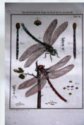
レーゼル昆虫図 (附属図書館蔵)