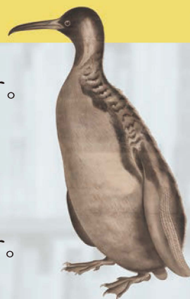
第四高等学校教育掛図「企鵝之 (ペンギン) 図」(附属図書館蔵) 加賀象嵌師の水野源六が若かり し日に描いたもの。墨で描かれ た一点もので、博物学の視覚教 材として利用されていた。